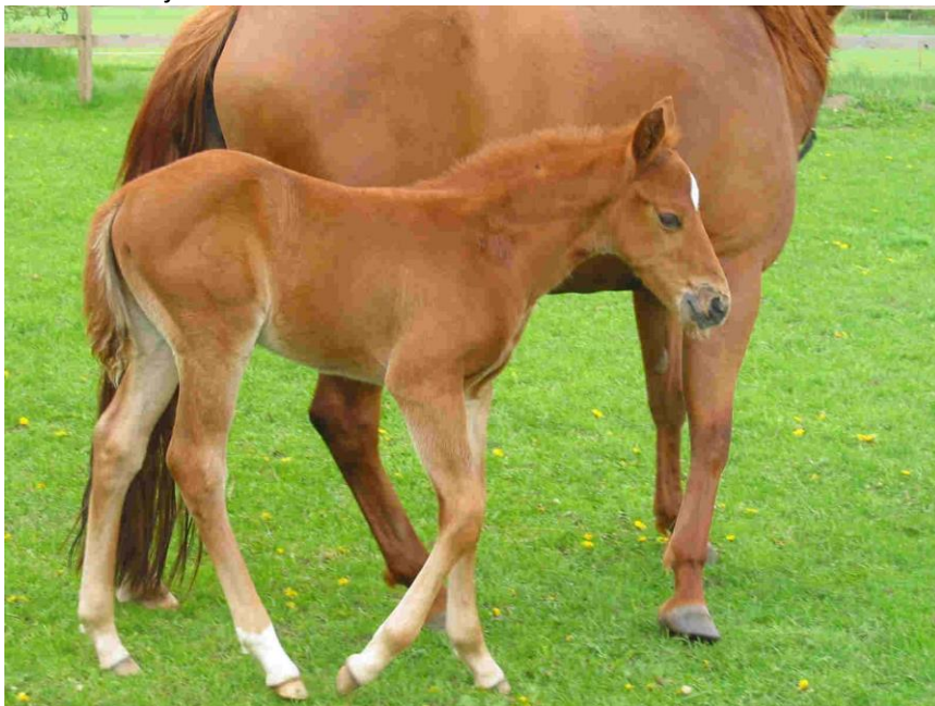
Little Mega Jac født 2003 – Mega Pine x Magical Jackie

Little Mega Jac blev født den 22. april 2003, altså er han i år 13 år gammel. Han var fra starten af en lille charmetrold og der var mange, der var forelsket i ham. Jac hører til blandt Mega Pines mest succesfulde afkom og der er ingen tvivl om, at han er det mest succesfulde Mega Pine afkom indenfor All-Around disciplinerne. Hans mor er hoppen Magical Jackie, som har Hollywood Jac 86 og Poco Bueno på papirerne, noget der efterhånden er en sjældenhed.